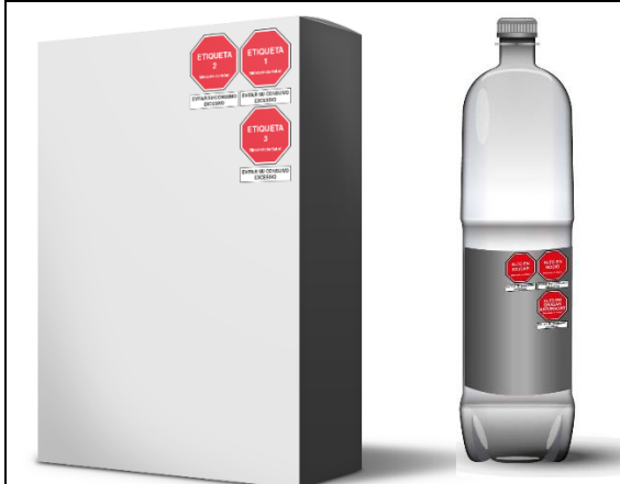
Tres advertencias publicitarias