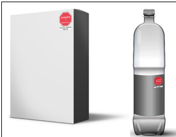
Una advertencia publicitaria: