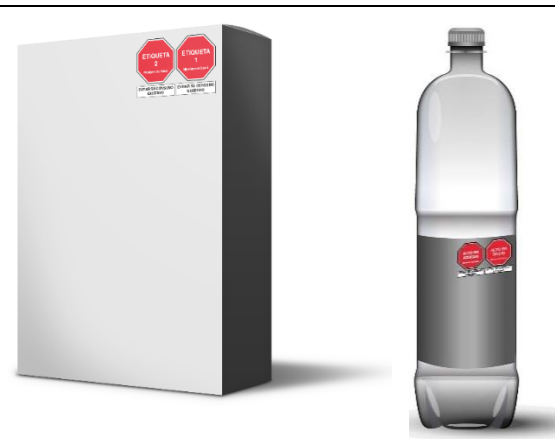
Dos advertencias publicitarias: