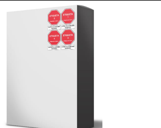
Cuatro advertencias publicitarias