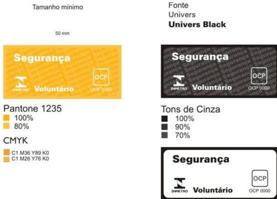
Figura 2 - Selo de Identificação da Conformidade para produtos com certificação voluntária