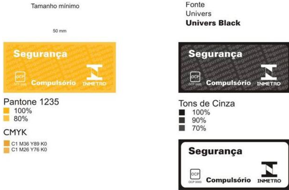
Figura 1 - Selo de Identificação da Conformidade para produtos com certificação compulsória