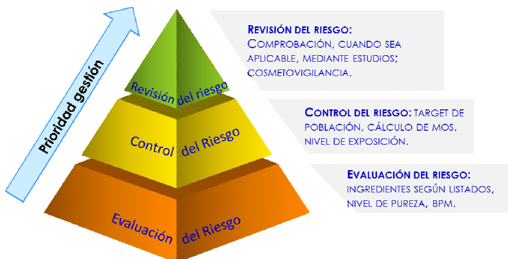
Figura 1. Prioridad en la gestión de la seguridad en cosméticos

La prioridad de la gestión de los riesgos en cosméticos se detalla en la figura 1. Allí se destacan algunos de los aspectos antes citados como la importancia de la aplicación y cumplimiento de las Buenas Prácticas de Fabricación (BPF), la selección adecuada de los ingredientes y la población a la cual está dirigido el producto.