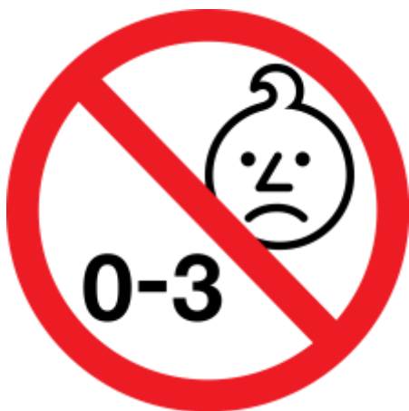
Figura 1: Símbolo gráfico de franja etaria inadecuada